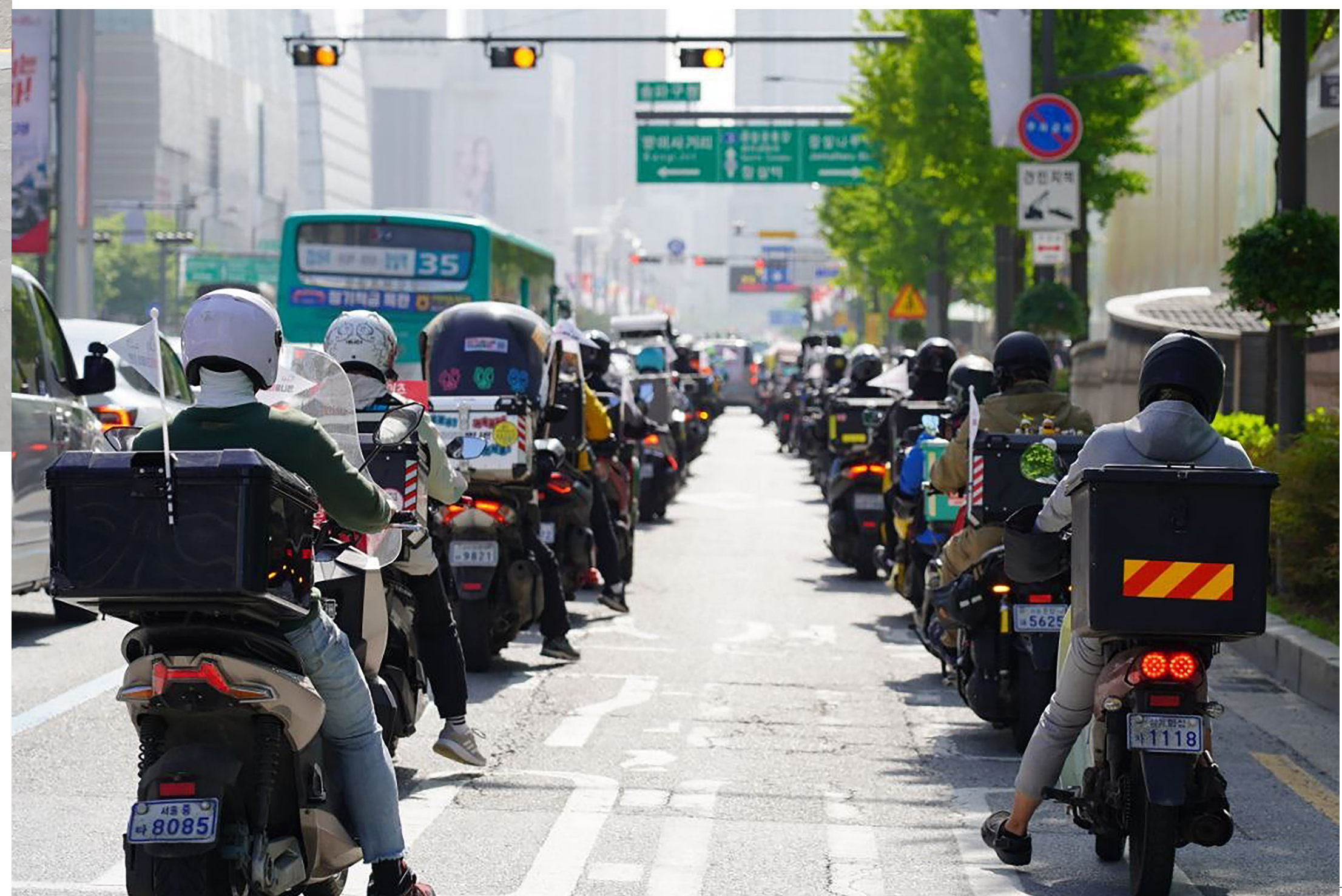
| 공공운수노조 라이더 행진

건당 수수료에 의지해 속도 전쟁 치르듯 일하는 라이더의 생명안전을 지키기 위해 배달료 인상이 필요하다.