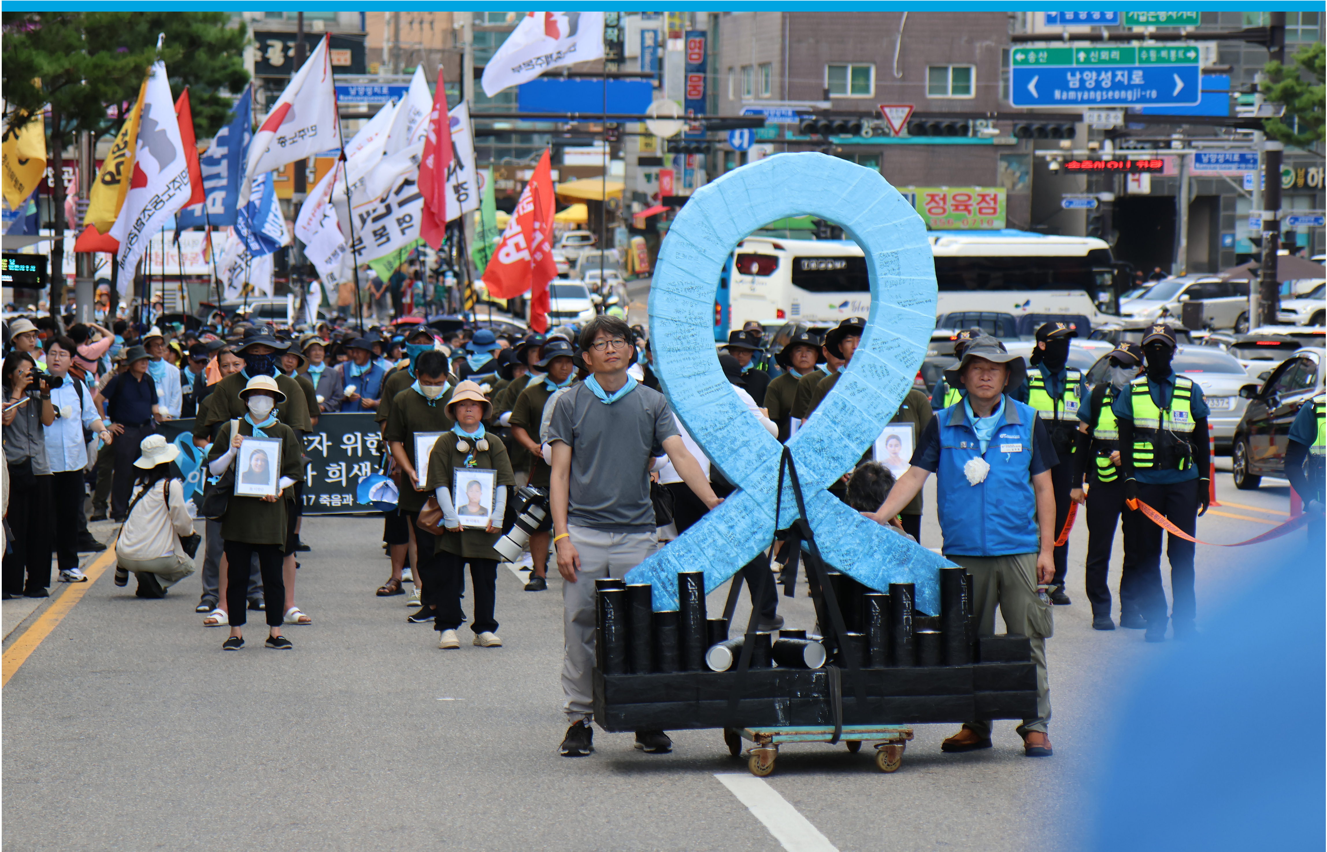
‘아리셀 희망버스’에 50개 도시, 100대 희망버스·승합차를 탑승한 2천여 명이 참여했다.

경기도 화성 1차전지 생산업체 아리셀공장 배터리 폭발사고로 노동자 23명이 죽고 8명이 다쳤다. 사망자 중 18명은 이주노동자로, 아리셀은 납품기한을 맞추려고 불법파견에 안전교육도 없이 무리한 생산공정에 투입했다. 정주·이주노동자, 피해유족은 참사 해결을 위해 함께 투쟁해왔다. 경영책임자 박순관에 1심 15년형을 선고, 현재 항소심 판결을 앞두고 있다.