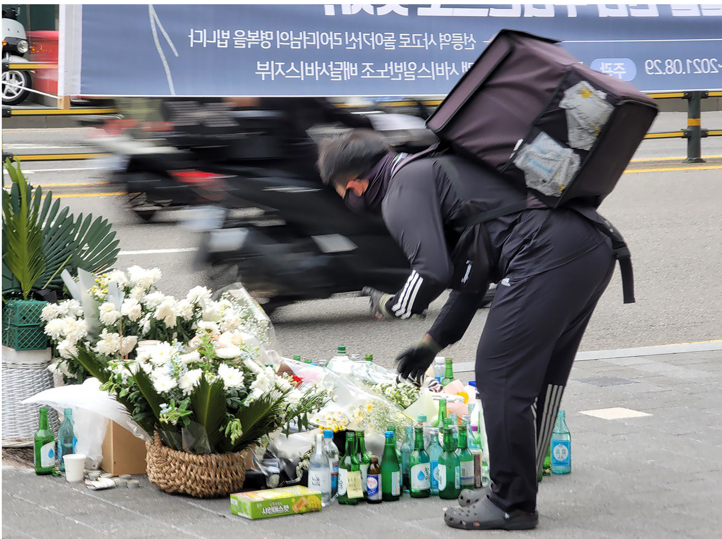
| 서비스연맹 선릉역 추모